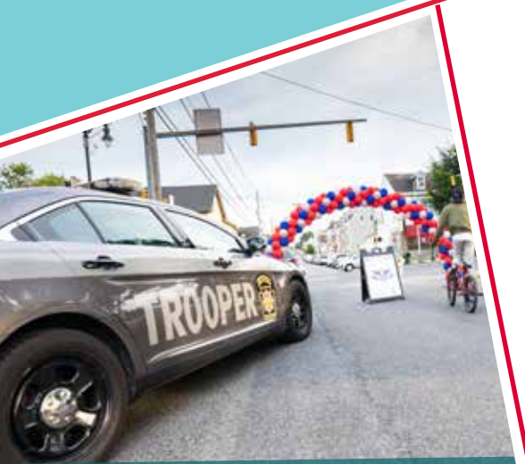
West Ward celebrated National Night Out on Aug. 3. Check out more event photos at westwardeaston.org/nno .

It's time to break out the lights! The West Ward House Decorating Contest will return for its second year. Deadline to sign-up to have your home included in the contest is Dec. 6.