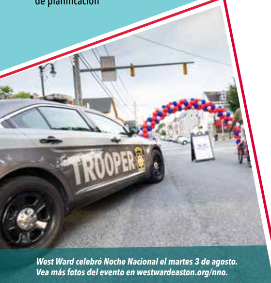
West Ward celebró Noche Nacional el martes 3 de agosto. Vea más fotos del evento en westwardeaston.org/nno .

Durante Noche Nacional, el equipo de Elección de vecindario creó un mapa mental comunitario de 18 pies a partir de preguntas hechas a la comunidad sobre las formas en que el vecindario de West Ward podría crecer.